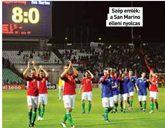
Szép emlék: a San Marino elleni nyolcas

2005-ben a Lothar Matthäus által irányított nemzeti tizenegy sima vereséget szenvedett Szófiában, világbajnoki selejtezőn. A bolgárok mindkét féldőben lőttek egy-egy gólt, előbb