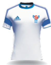
Feröer: fehér mez, kék nadrág, fehér sportszár