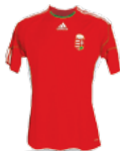
Magyarország: piros mez, fehér nadrág, zöld sportszár