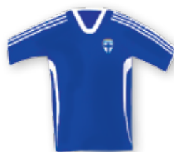
Finország: kék mez, kék nadrág, kék sportszár