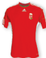
Magyarország: piros mez, fehér nadrág, zöld sportszár